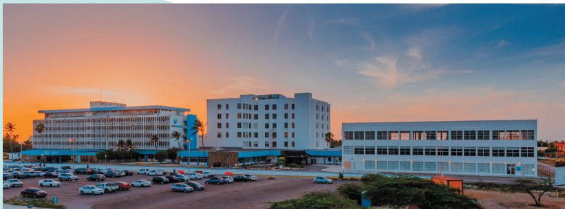
Horacio Obuder Hospital - Aruba

Ongeveer een week voorafgaand aan de operatie heeft u een afspraak met de Bariatrisch Consulent (consulent voor obesitas of zwaarlijvigheid) op Aruba. Deze bespreekt samen met u de laatste dieetadviezen. Ook regelt de consulent de pre-screening voor de operatie bij de anesthesist. De anesthesist spreekt met u over de narcose tijdens de operatie.